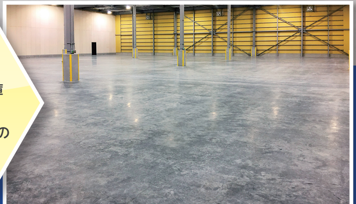
下地コンクリート 騎乗式トロウエル抑えの例

流通センター 冷蔵・冷凍倉庫等の倉庫 店舗、製造工場、 重量物・フォークリフト等の 往來で床を酷使用する場所