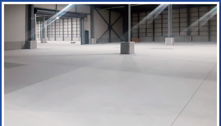
下地コンクリート フレスノ抑えの例